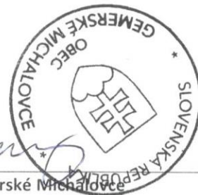
Obec Gemerské Michalovce